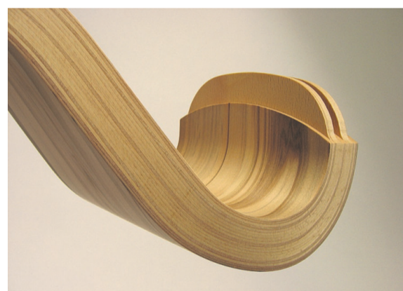
Formteil aus laminierten Holzschichten.