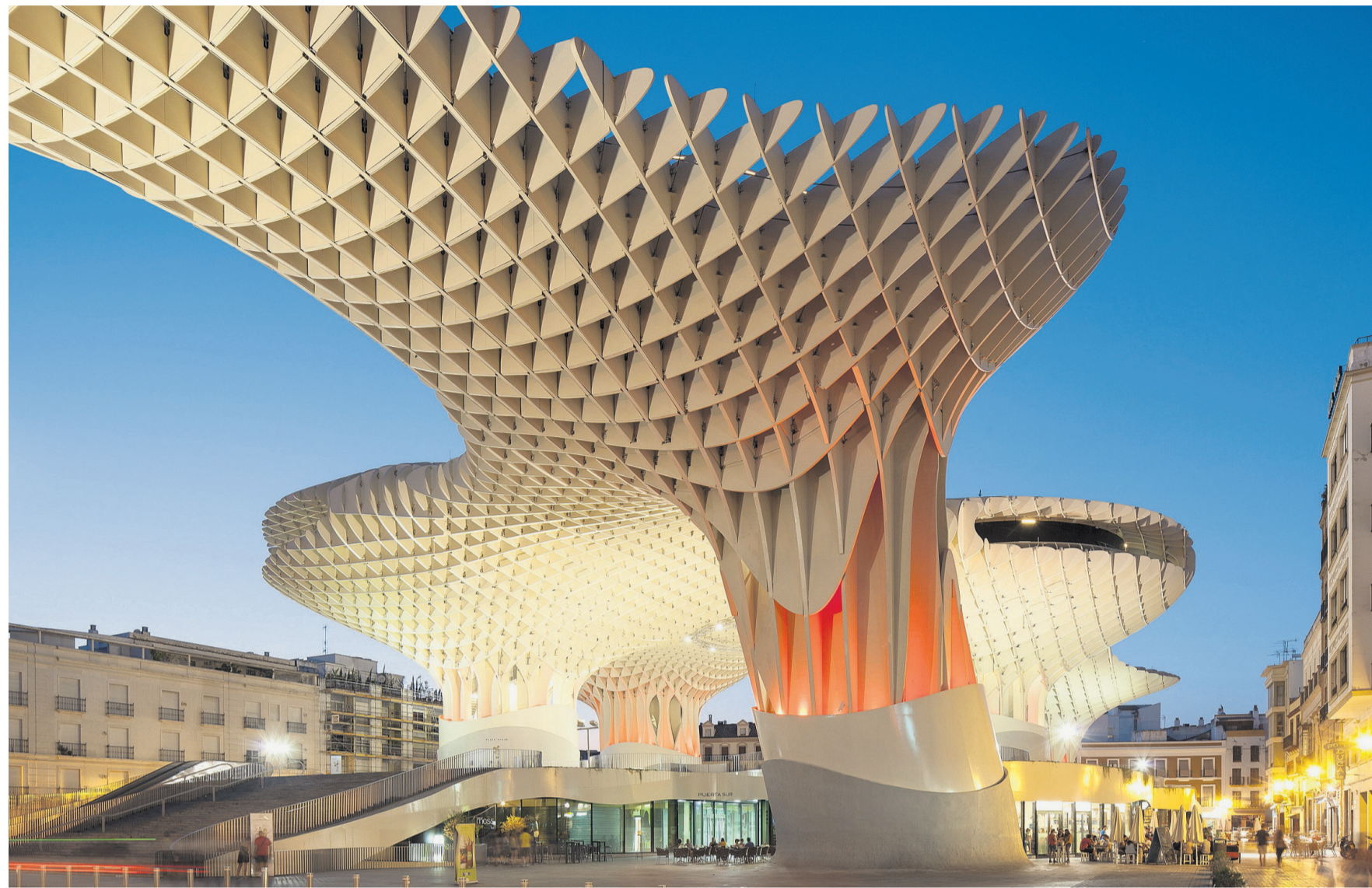
Der «Metropol Parasol» in Sevilla wurde fast vollständig aus Holz errichtet.

Überhaupt, Holz ist Auto: Vor 100 Jahren war das eine Selbstverständlichkeit. Auch die Karosserie des legendären Ford-T war aus Holz zusammengeleimt. An der Universität Kassel will man dem Holzauto zumindest teilweise eine Renaissance bescheren. Im Projekt